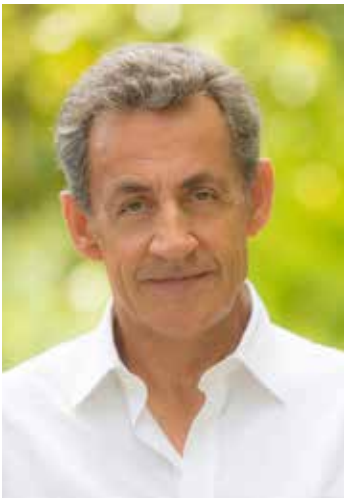
Discours inaugural par le président Nicolas Sarkozy le 16 septembre

Un Forum de la ville dédié aux décideurs des collectivités locales françaises aura lieu également le 16 septembre pour favoriser un partage d'expériences et faire un premier bilan.